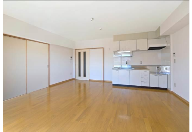
リビング・ダイニング（2LDK）