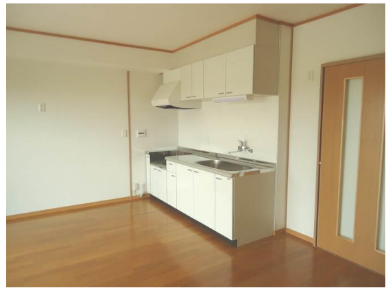
リビング・ダイニング（2LDK）